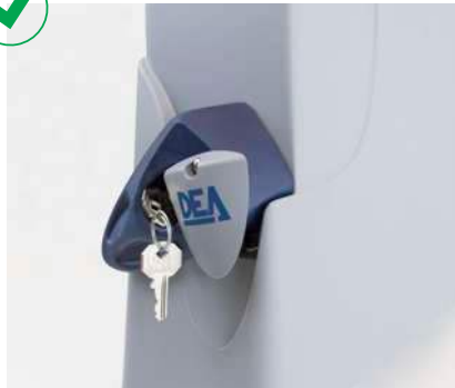
Déverrouillage d'urgence sécurisé avec clé personnalisée