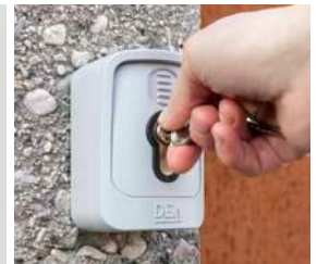
Sélecteur à clé GT-KEY