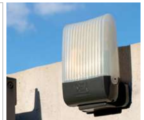
Lampe clignotante AURA