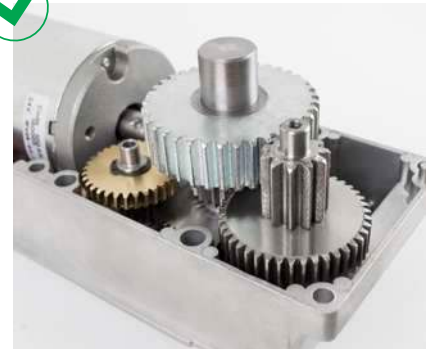
Mécanique interne longue durée en métal avec roulements à billes