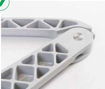
Bras renforcé en aluminium