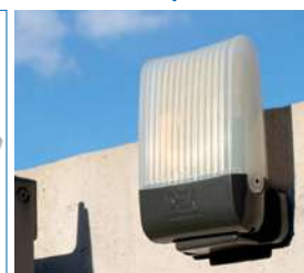
Lampe clignotante AURA