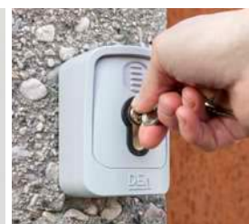
Sélecteur à clé GT-KEY